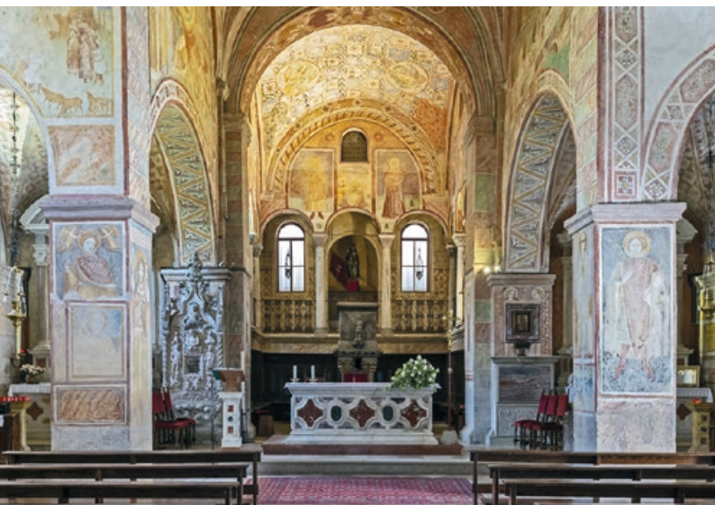
Santuario dei SS. Vittore e Corona: interno e chiostro