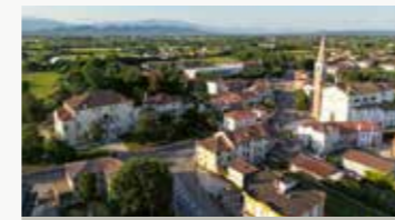
Riese Pio X