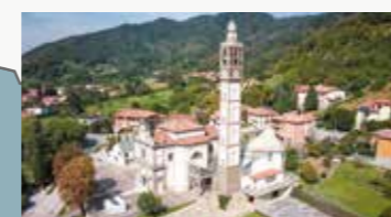
Sotto il Monte Giovanni XXIII